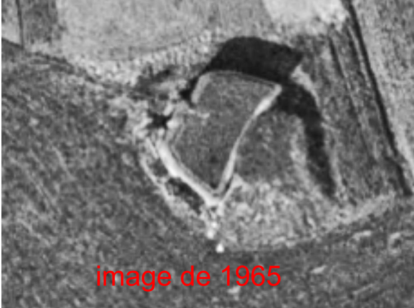
image de 1965