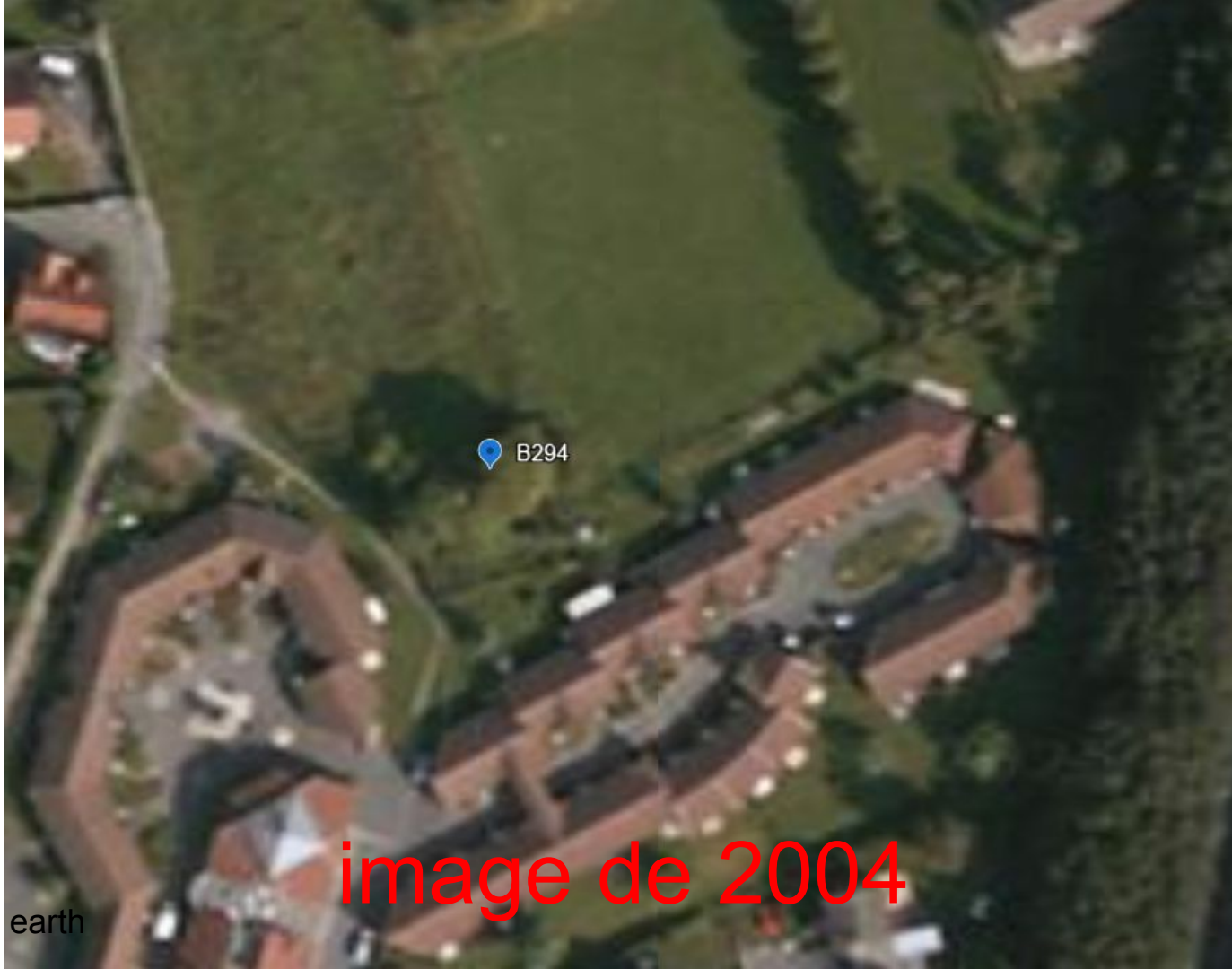
image de 2004