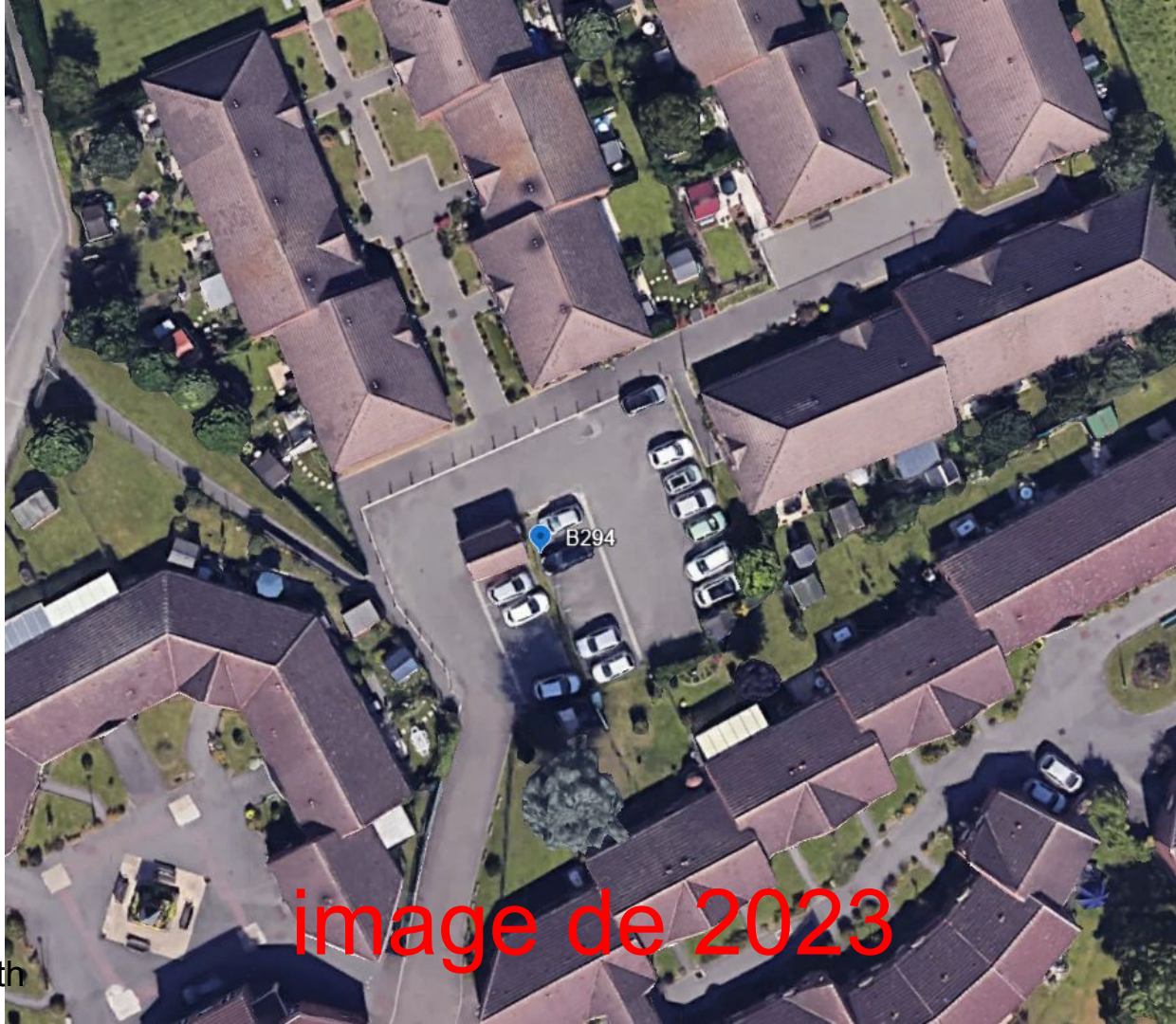
image de 2023