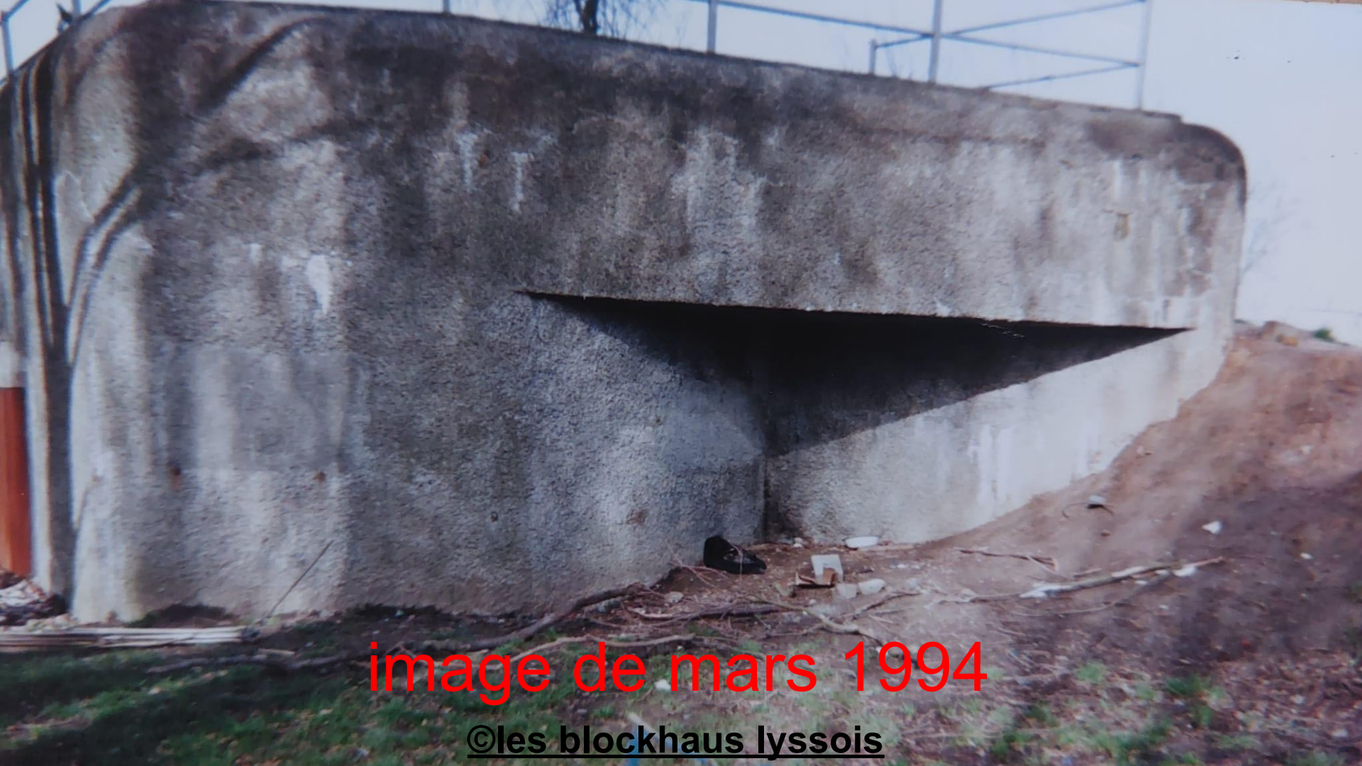
image de mars 1994