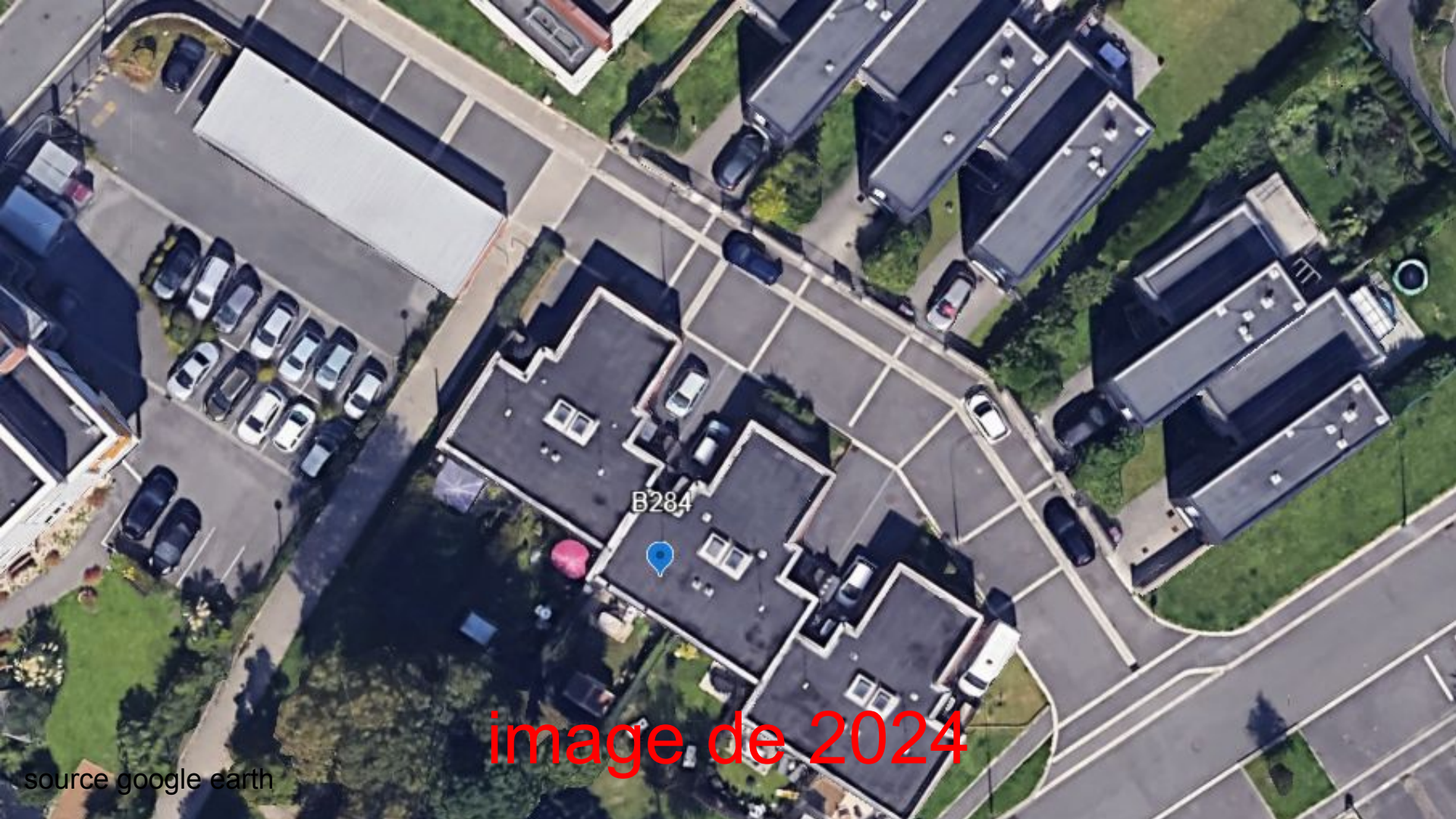
image de 2024