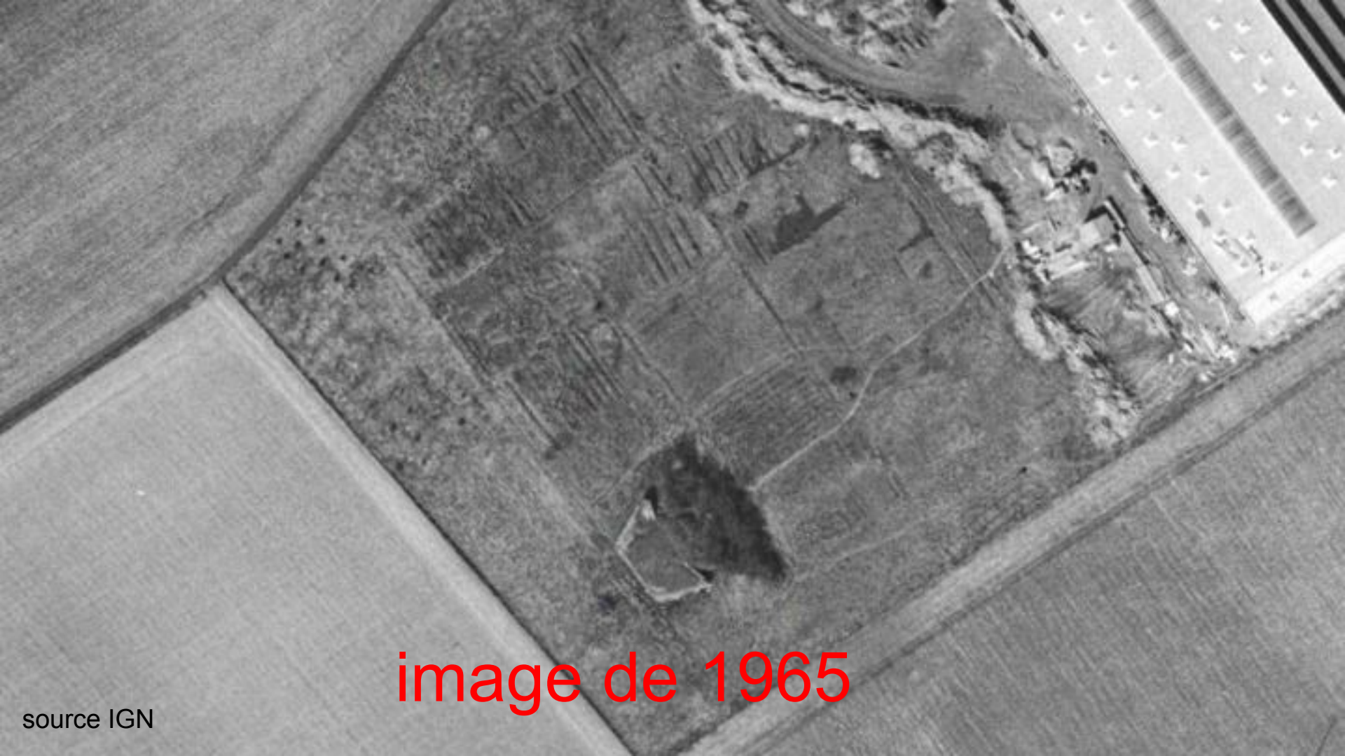
image de 1965