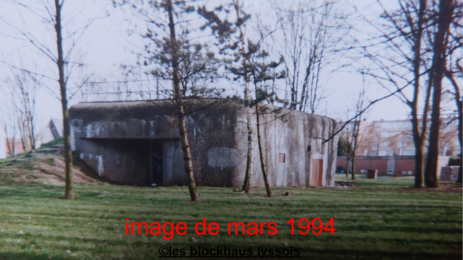
image de mars 1994